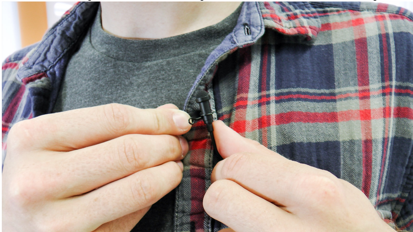
Befestigen Sie das Lavalier-Mikrofon an einem Hemd, einer Krawatte oder einer Falte im Shirt. Achten Sie darauf, dass die Kapsel am Kopf des Mikrofons nicht über den Stoff reibt. Dies verursacht Störgeräusche, da das Mikrofon am Stoff kratzt. Das Mikrofon sollte in etwa zur gleichen Entfernung zum Mund angebracht sein, wie im Beispielbild zu sehen.