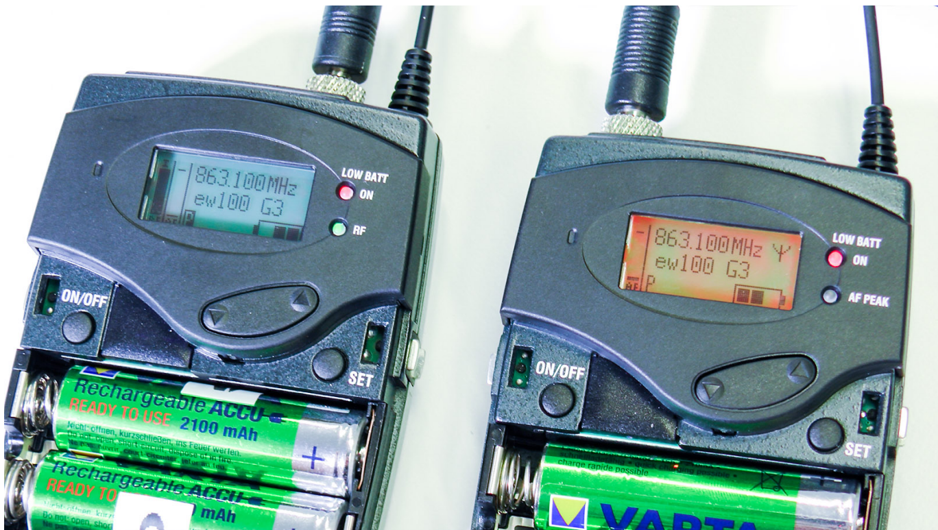
Sobald die Verbindung zwischen den Geräten hergestellt ist, verschwindet die „MUTE“-Anzeige.