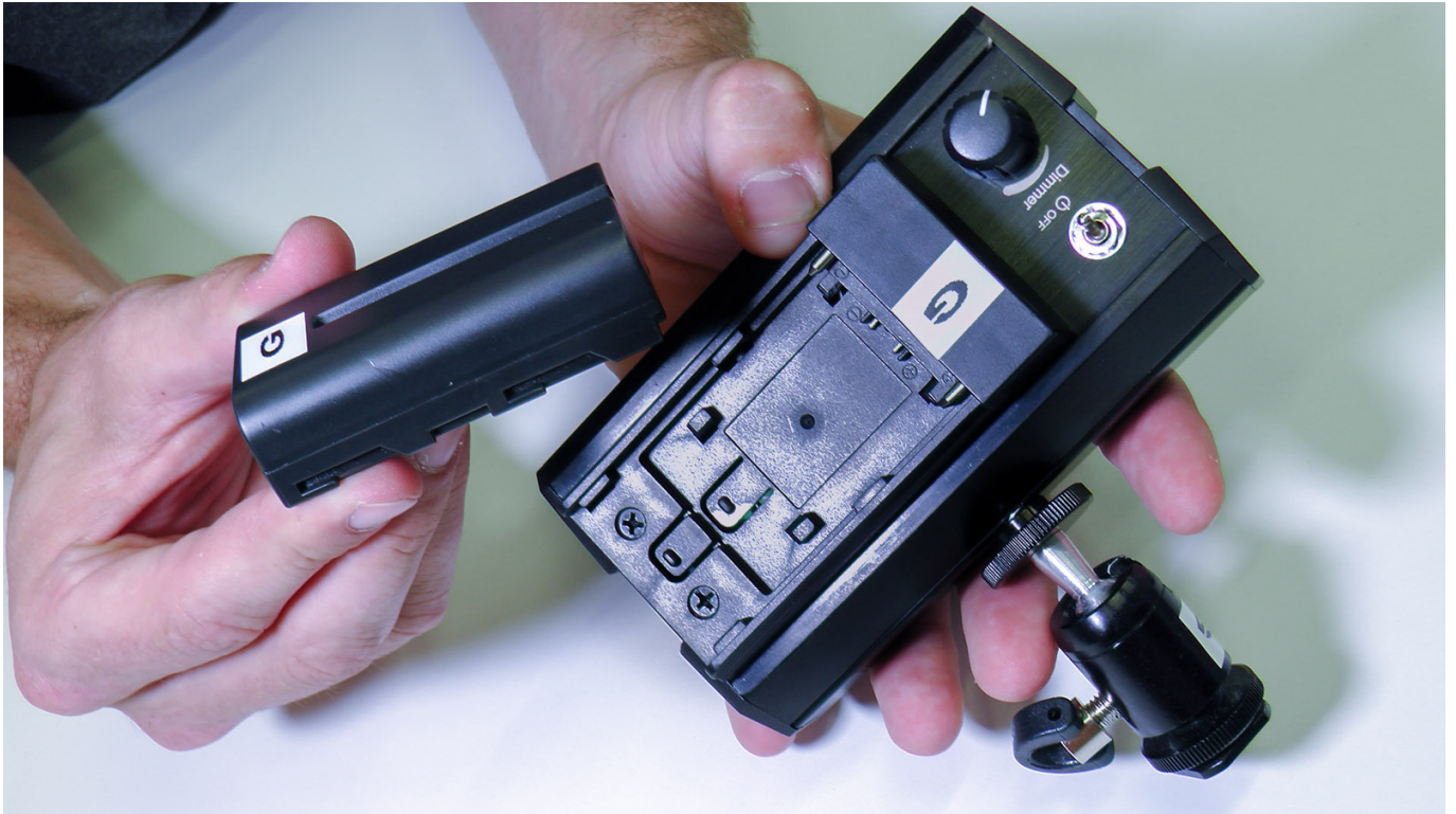
Setzen Sie den Akku ein.