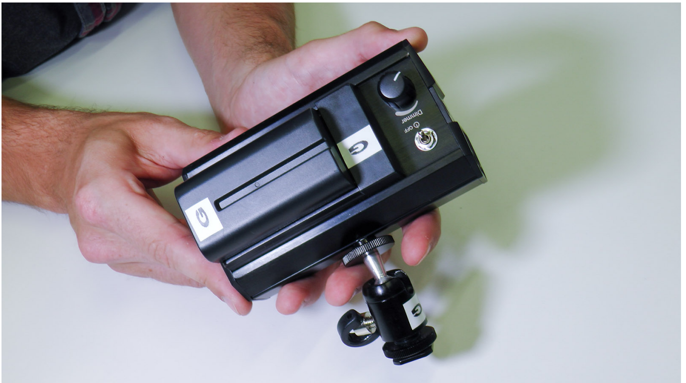
Der Akku rastet auch hier spürbar ein. Erst dann sitzt er fest.